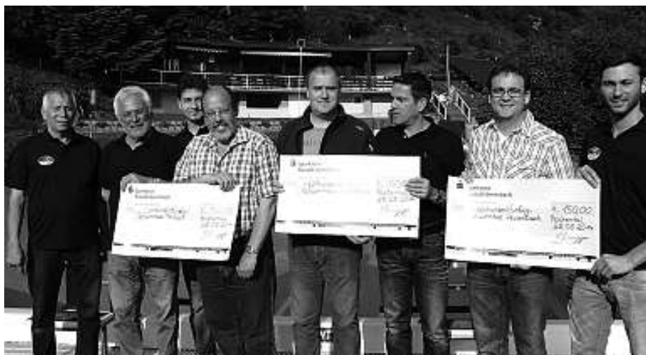
Die Vertreter der Fördervereine der Bäder Weisenbach und Reichental sowie des Murganabades Forbach freuen sich über die Spende der DLRG Ortsgruppe Weisenbach-Reichental-Forbach.