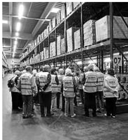
Im Lager der EDEKA-Zentrale Offenburg.

und Teilnehmer von Fitterer Junior, vom Weisenbacher Einkaufsmarkt, begrüßt.