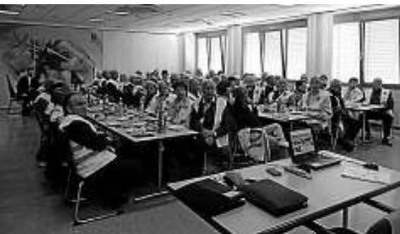
In der EDEKA-Zentrale Offenburg.

Nach mehrtägigem Regenwetter meinte es der Wettergott gut mit den 109 jüngeren und älteren Weisenbacher Mitbürgerinnen und Mitbürger, die vergangene Woche beim 20. Senioren-Tagesausflug in der Region Offenburg, Kinzigtal und Rheinebene unterwegs waren.