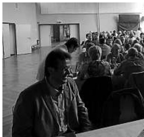
Bewirtung erfolgte durch das DRK.

Das Mittagessen wurde im "Landhotel Mühlentof" in Friesenheim eingenommen. Den Nachmittag ge-