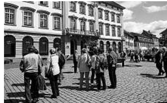
Vor dem Rathaus Gengenbach.

staltete jedermann in Kleingruppen in der romantischen und historischen Stadt Gengenbach, mit vielfältigen Möglichkeiten für Besichtigungen und einem kleinen Stadtparziergang. Sehenswert die Stadtkirche, die mittelalterlichen Häuser, insbesondere in der Engelsgasse und in der Stadtmitte beim Rathaus. Hier fand jeder auch einen sonnigen Platz in einem Straßencafé bei Eis und leckerem Kuchen.