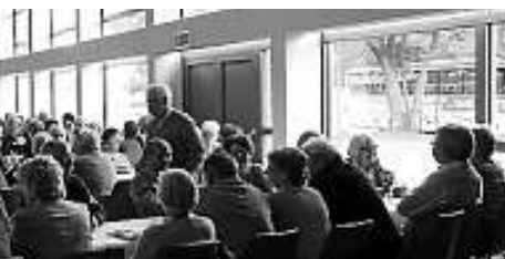
Abschluss in Muckenschopf, Lichtenau.

Alle Teilnehmerinnen und Teilnehmer des Ausfluges äußerten ihre Freude über einen informativen, erlebnisreichen und geselligen gemeinsamen Tag.