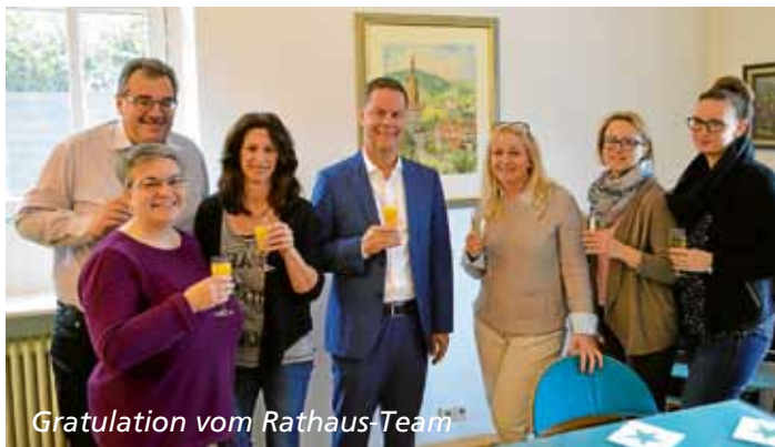
Gratulation vom Rathaus-Team