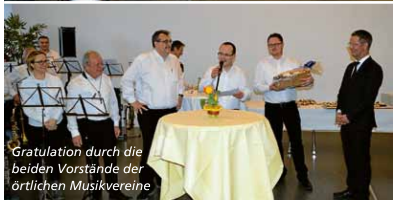
Gratulation durch die beiden Vorstände der örtlichen Musikvereine