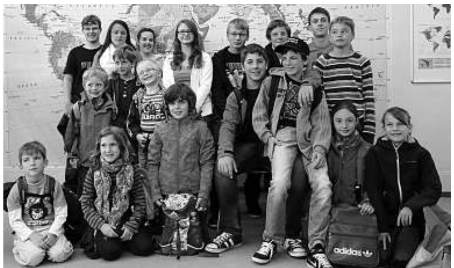
Ausflug zur Experimenta in Freudenstadt

Beim Frühjahrskonzert des Musikvereins Weisenbach eröffneten die „L.A.-Youngsters“ das Konzert. Mit den modernen Titeln „Mission Impossible Theme“, „The James Bond Theme“ und „Pirates of the Caribbean“ leisteten die Nachwuchsmusikerinnen und Nachwuchsmusiker unter der Leitung von Helmut Gerstner einen tollen Beitrag zum Programm und begeisterten die Besucherinnen