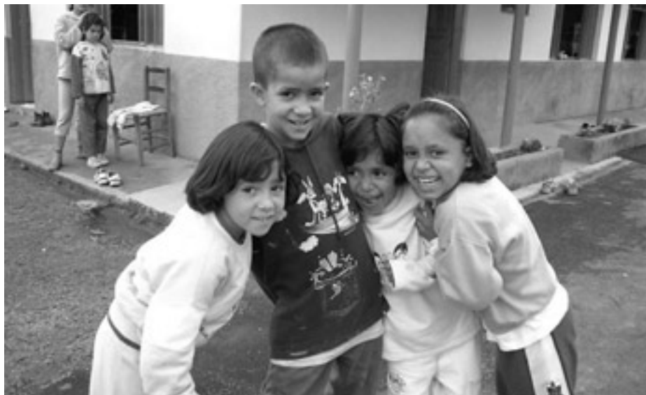
Kinder aus der Armensiedlung neben dem Kinderdorf. Einmal in der Woche werden im so genannten Projekt 90 Kinder aus der Siedlung zusätzlich gefördert.

In herzlicher Dankbarkeit für die gewährte Hilfe schließt sich das »Eine-Welt-Team« diesen Wünschen an, verbunden mit der Bitte, das Kinderdorf auch in diesem Jahr zu unterstützen.