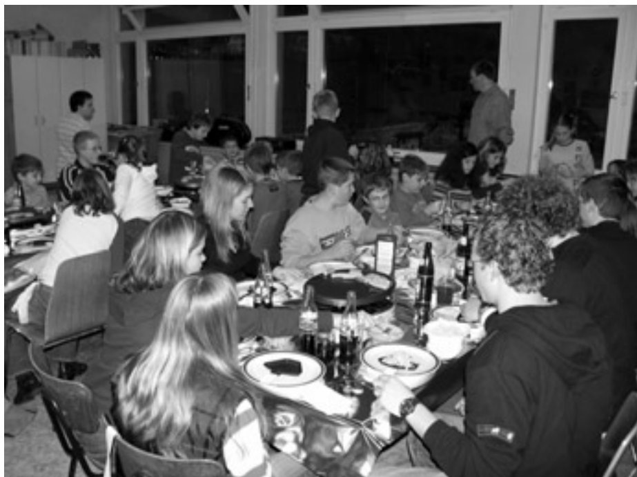
Die Nachwuchsmusiker beim gemütlichen Raclette-Essen.

Die Weihnachtsferien nutzten die Kinder und Jugendlichen der Musikkapelle Au zum Treff mit den befreundeten Kindern und Jugendlichen des Musikvereins Langenbrand. Rund 20 Kinder und Jugendliche, welche zu Fuß von Langenbrand unterwegs waren, wurden im Proberaum erwartet.