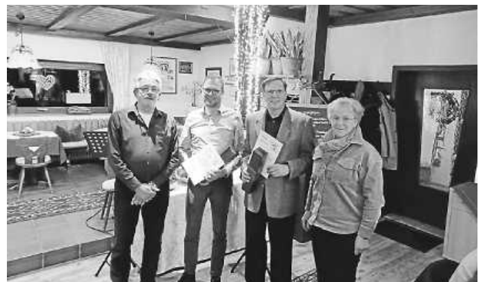
25 Jahre Passive 2023.