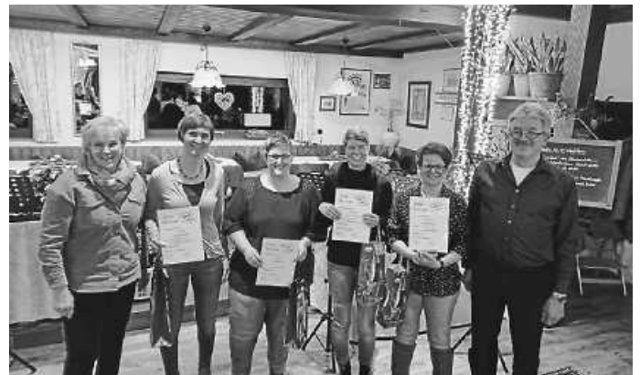
25 Jahre Aktive 2023.