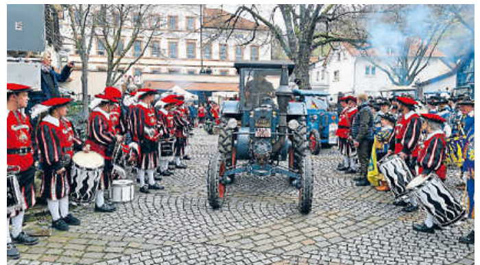
LANZ beim Festzug