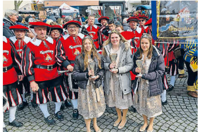
Weinköniginnen der Bergstraße

Nächster Termin ist die Sektionsprobe in Weisweil/Rhein, am Sonntag, den 26.03.