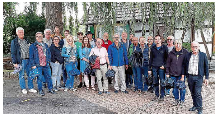
Die Teilnehmenden vor der ehemaligen Glashützensiedlung.