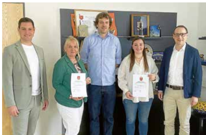
Die Bürgermeister mit den bestellten Standesbeamtinnen.