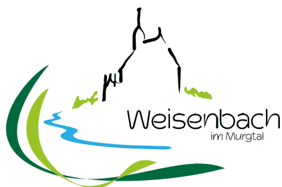
Sitzung des Gemeinderates am 18. April 2024, 19 Uhr