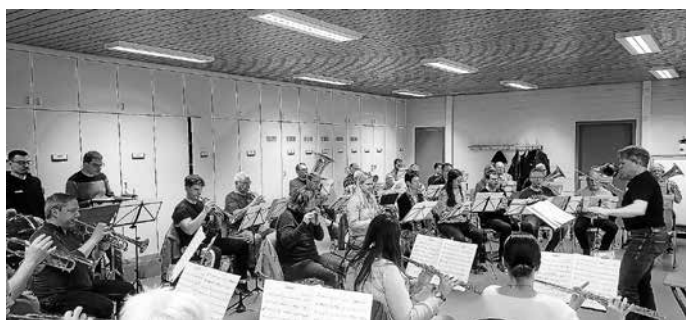
Aktuelle Probenarbeit für das Jubiläumskonzert.

Am Samstag und Sonntag, 6. und 7. Juli, findet ein zweitägiges Fest im Pfarrgarten und im Gemeindehaus statt, zu dem zu gegebener Zeit gesondert eingeladen und informiert wird.