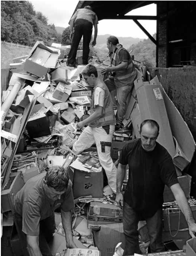
Altpapiersammlung am Sa., 13. April.

Die Helfer treffen sich um 8.45 Uhr in der Schlechtau. Bitte Warnwesten dabeihaben.