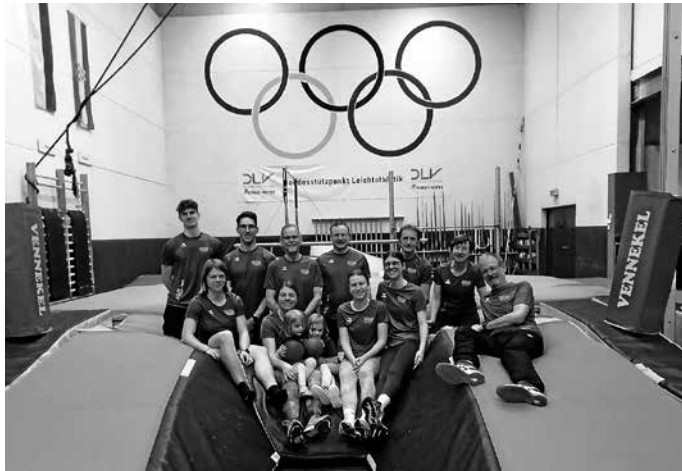
LAG-Sportler unter den Olympischen Ringen.

Vom 2. bis 5. April nutzten die Sportler der LAG Obere Murg die optimalen Bedingungen in Zweibrücken, um sich im Olympiastützpunkt für die Saison vorzubereiten. In der Halle der LAZ Zweibrücken konnten alle Disziplinen unter optimalen Bedingungen trainiert werden: Sprint, Kugelstoßen sowie Weit- und Hochsprung. In der Halle standen zwei Stabhochsprunganlagen zur Verfügung. Durch ein Wurfnetz bedingt waren sogar vorbereitende Schlagwürfe möglich. Weiterhin konnte der Krafraum und alle Turngeräte benutzt werden. Neben der Halle befindet sich direkt das Stadion mit einer 400-m-Bahn für Laufeinheiten im Freien. Trainiert wurde jeden Tag von 10.00 bis 16.00 Uhr, unterbrochen mit einer kleinen Mittagspause. Ein besonderer Reiz in Zweibrücken besteht darin, dass neben unserer Trainingsgruppe sich Welt- Europa- und Deutsche Meister auf die bevorstehende Saison vorbereiten. Dies waren die Stabhochspringer Raphael Holzdeppe (Weltmeister und mehrfacher Deutscher Meister), Oleg Zernikel Deutscher Meister und Fünfter bei den Weltmeisterschaften 2022. Christin Hussong die Speerwurfeuropameisterin von 2018 absolvierte wie unsere Sportler ein zweimaliges Training am Tage mit Sprint, Sprungkraft, Krafttraining und Würfe im Stadion.