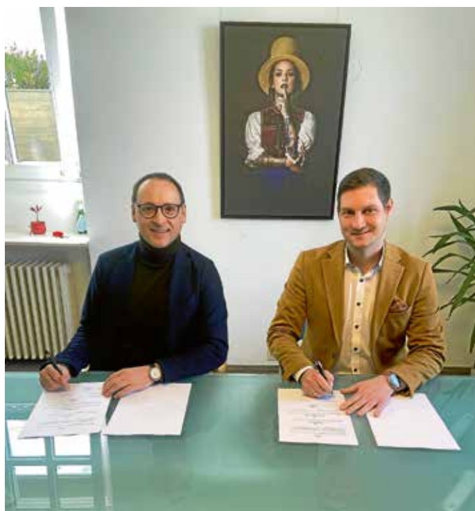
Die Bürgermeister bei der Unterzeichnung des Vertrages.