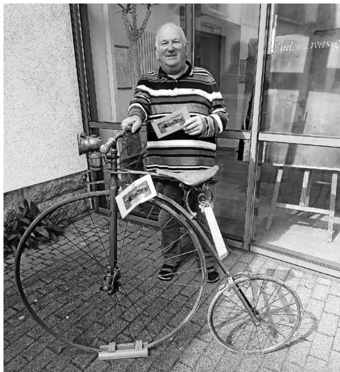
Hochrad Heimatmuseum Bermersbach.

Über die neuesten Räder auf dem Markt können sich die Gäste beim „Hock an der Brück“ von 10.00 bis 17.00 Uhr in einem Informationszelt des Fahrradladens „Tillit Bikes“ informieren. Die Mitarbeiter sind selbst MTB-Sportler und nutzen ihre Erfahrung aus Rennsport und Bike-Alltag zur kompetenten Beratung.