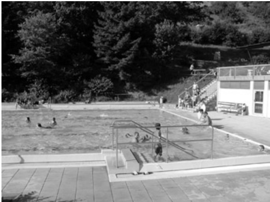
Am Wochenende findet das 4. Weisenbacher Schwimmbadfest statt.

In einem der schönsten Freibäder des Murgtals veranstaltet der TV Weisenbach das 4. Weisenbacher Schwimmbadfest. Mit dabei ist wieder die Volksbank Baden-Baden/Rastatt mit dem Conférencier Monsieur Martini-que. Startbeginn ist am Samstag, 22. Juli, um 14 Uhr. Wegen dem Schwimmbadfest ist der Eintritt am Samstag-nachmittag frei.