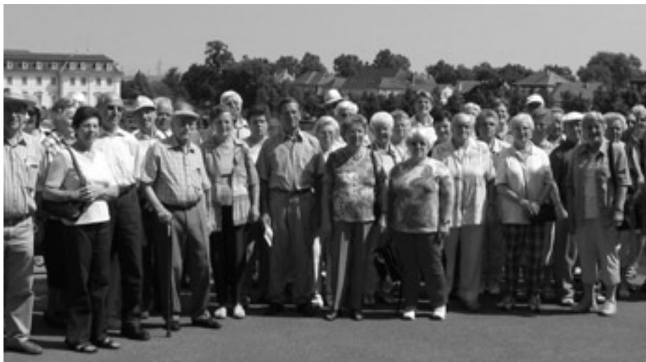
Einen schönen Tag erlebten die Teilnehmer beim Jahresausflug.

Einen wunderschönen Tag erlebten die Ausflugsteilnehmer am Samstag bei der Fahrt zum »Blühenden Barock« in Ludwigsburg. Bei strahlendem Sonnenschein und wolkenlosem Himmel konnte man den Blütenduft und Märchenzauber in den weitläufigen Gärten genießen.