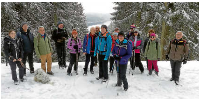
Blick auf die Schwarzwaldtalsperre

Die Wanderung startete von Weisenbach aus mit einer Zugfahrt nach Forbach und danach mit dem Bus weiter nach Herrenwies. Nach einer kurzen Information zur bevorstehenden Tour machte man sich auf den Weg in Richtung Herrenwieser See. Durch eine herrliche Winterlandschaft mit einer Pulverschneeauflage von ca. 25 cm erreichte die Wandergruppe über den Bussemer-Stein die Badener Höhe auf 1002 m. Hier machte man eine längere Mittagspause in der man köstliche Leckereien (Liköre, Schnäpse und Gebäck) verteilte. Ein besonderes Erlebnis für alle Teilnehmer/innen in einer so schönen und reizvollen Winterlandschaft gemeinsam wieder wandern zu können. Ausgeruht folgte man der Wanderroute im Tiefschnee über den Badener-Höhen-Hang zum Badener-Sattel um den Eierkuchenberg zur Roten Lache. Von nun an ging es bergab nach Weisenbach wo man in einem örtlichen Gasthaus einkehrte. Der Gegenbesuch in Frankreich ist am 11.09.2022 geplant.