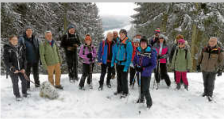
Naturfreunde wandern mit französischen Wanderfreunden