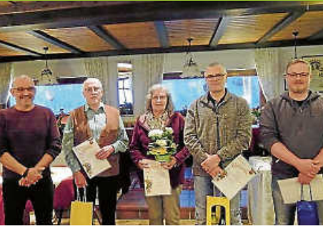
Ehrungen beim OGV Au

Amtsblatt der Gemeinde Weisenbach Diese Ausgabe erscheint auch online