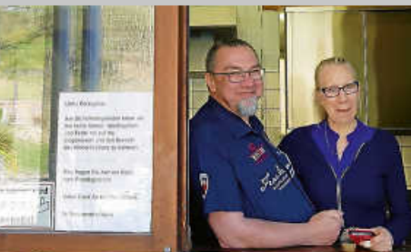
Die neuen Kioskpächter vom Latschigbad