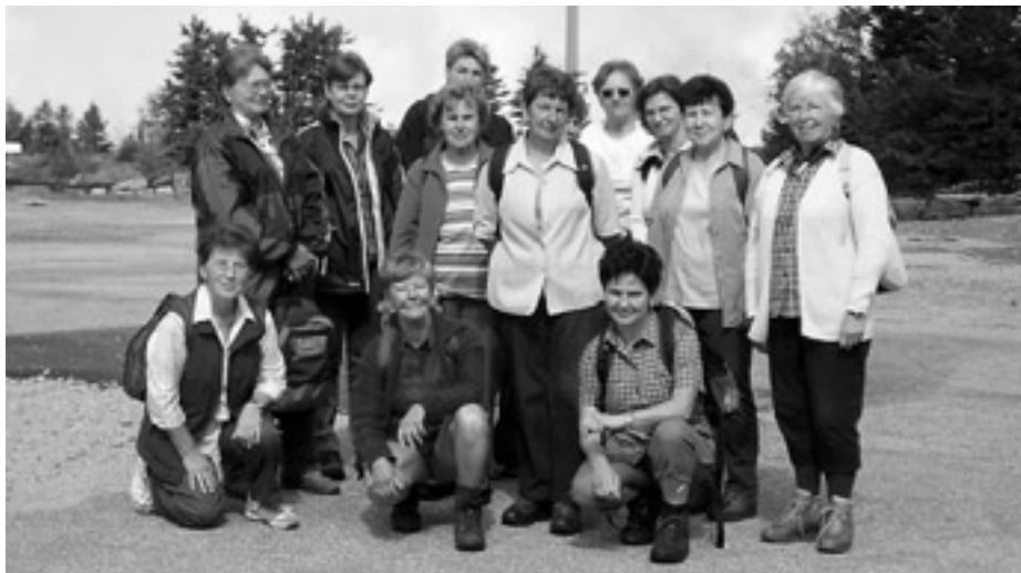
Die Wandergruppe auf der Hornisgrinde

Schönes Herbstwetter hatten wir bei unserer nun schon traditionellen Herbstwanderung am 20. September. Das Ziel hieß in diesem Jahr Hornisgrinde. Ausgangspunkt war Unterstamm. Von der Hornisgrinde wanderten wir weiter zum Mummelsee. Nach einer ausgedehnten Kaffeepause am Mummelsee fuhren wir mit dem Bus und dann mit der Stadtbahn zurück nach Weisenbach.