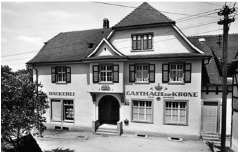
80 Jahre bewegte Geschichte hat das Gasthaus zur »Krone« hinter sich.