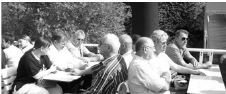
50 Mitglieder der Kolpingfamilie Weisenbach machten bei herrlichem Spätsommerwetter eine Fahrt ins Blaue.

Fahrt ins Blaue hat die Kameradschaft gestärkt und bleibt für alle Teilnehmer noch lange in bester Erinnerung.