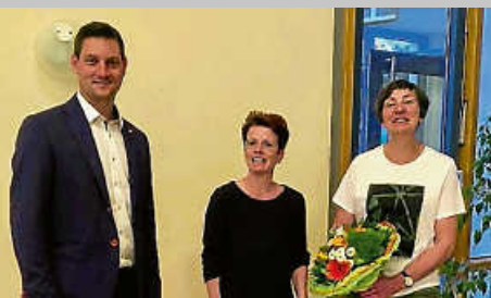
Jahreshauptversammlung kath. Frauengemeinschaft