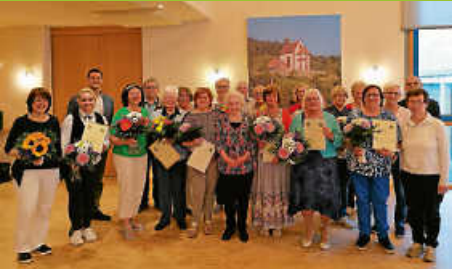
Zahlreiche Ehrungen beim Kirchenchor Weisenbach/Au

Amtsblatt der Gemeinde Weisenbach Diese Ausgabe erscheint auch online