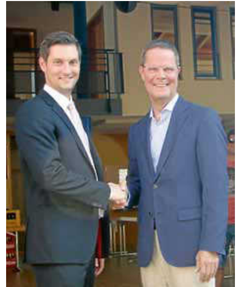
Vorgänger gratuliert Nachfolger