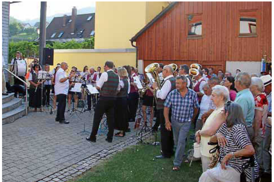
Musikvereine und Fanfarenzug gratulieren