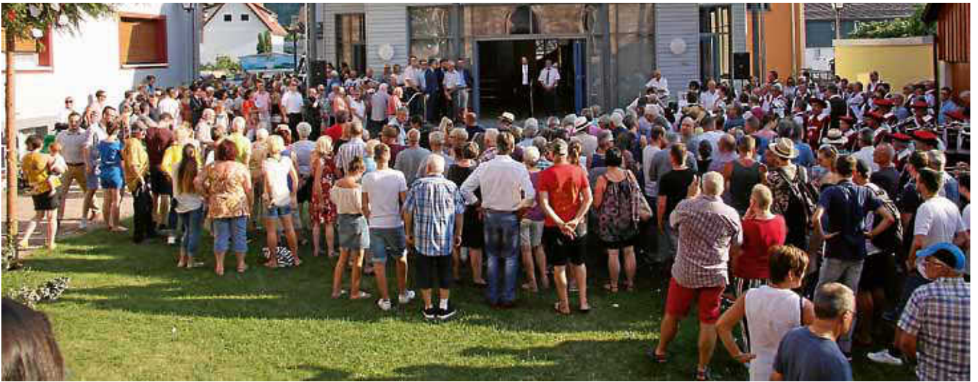
Zahlreiche Wählerinnen und Wähler verfolgen die Bekanntgabe des Wahlergebnisses

Viel Spannung lag am überaus heißen vergangenen Sonntag in der Luft, als nach Schließen der Wahllokale das Ergebnis der Bürgermeisterwahl ermittelt wurde.