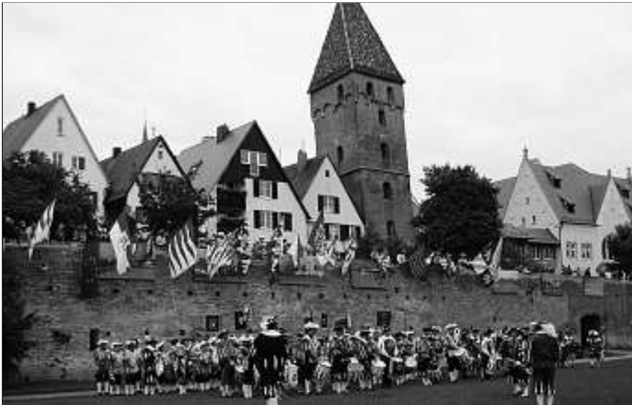
Der Fanfarenzugverband spielte gemeinschaftlich auf den Ulmer Donauwiesen.

Am vergangenen Wochenende konnten wir die Weisenbacher Farben beim Landesfestzug der baden-württembergischen Heimattage zeigen. Gemeinsam mit drei weiteren Fanfarenzügen der Verbandssektion Süd gehörten wir zu den 3.000 Aktiven, die in 80 Trachten- und Musikgruppen sowie Bürgerwehren am Umzug durch die Ulmer Innensstadt teilnahmen. Bereits am Aufstellungsort zeigte sich ein Meer an farbenprächtigen Trachten und Uniformen aus dem ganzen Ländle bis hin zu einer latein-amerikanischen Einwanderergruppe. Das Aufstellen in Umzugsordnung war aus Platzmangel nicht möglich, so ein Gewimmel war dort durch die vielen Gruppen. In der Hauptsache nahmen Fußgruppen teil. Auch an