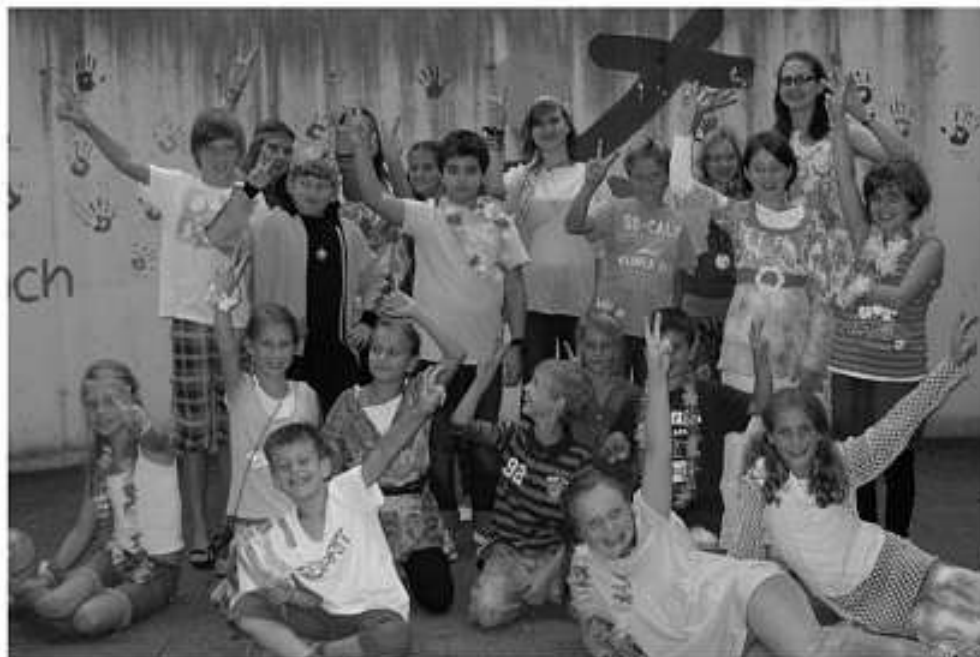
Die Beach-Party der Minis war wieder super schön.

Die selbstgestalteten Glückwunschkarten bereiteten den kleinen „Künstlern“ sehr viel Freude