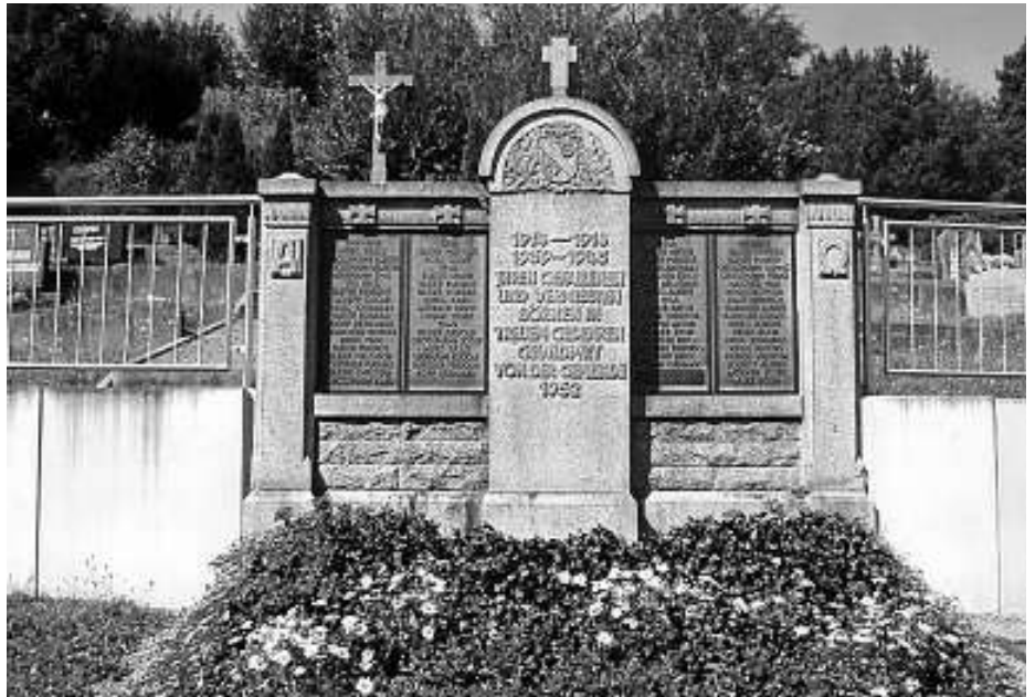
Gedenktafel für die Gefallenen und Vermissten.

Der Friedhof musste in den letzten 50 Jahren in westlicher und nördlicher