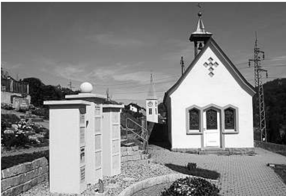
Urnenstelen vor der Friedhofskapelle.

Quellen: Dorfchronik Au von 1937 und Gemeindechronik Weisenbach