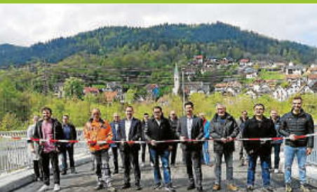
Einweihung Brücke Schlechtau

Amtsblatt der Gemeinde Weisenbach Diese Ausgabe erscheint auch online