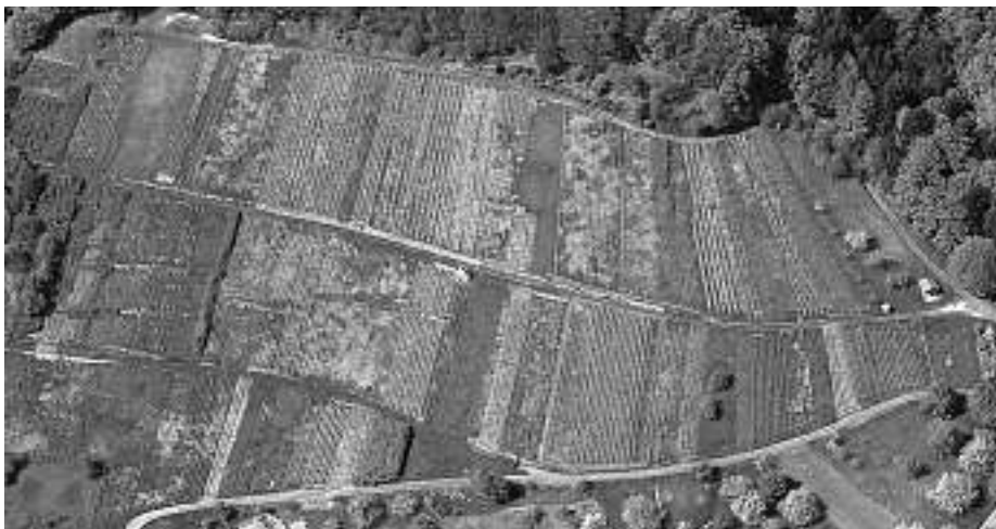
Aufnahme von Frühjahr 2008.

Aufgrund anderer, vielfältiger Arbeiten und der für den Umbau notwendigen hohen Investitionen war dem Weingut »Schloss Eberstein« eine kurzfristige Übernahme des Weinbergs »Kapf« nicht möglich. Die Gemeinde, so Bürgermeister Toni Huber, machte sich daher im Laufe der letzten Monate auf die Suche nach weiteren Lösungsmöglichkeiten zur Zukunftssicherung. Die vor wenigen Ta-