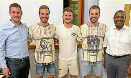
2000 Euro Spende bei Bilder- rückblick über Uganda

Amtsblatt der Gemeinde Weisenbach Diese Ausgabe erscheint auch online