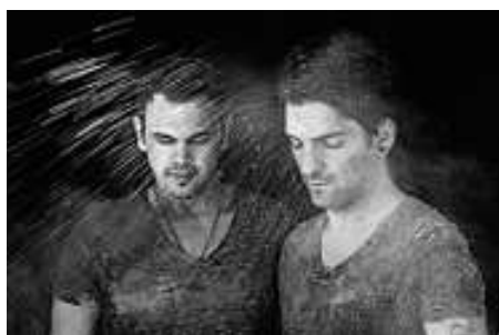
Fireworks & Fairytales

Mehr über die beiden Bands unter www.freizeitclub-weisenbach.de und www.fussballclub-weisenbach.de