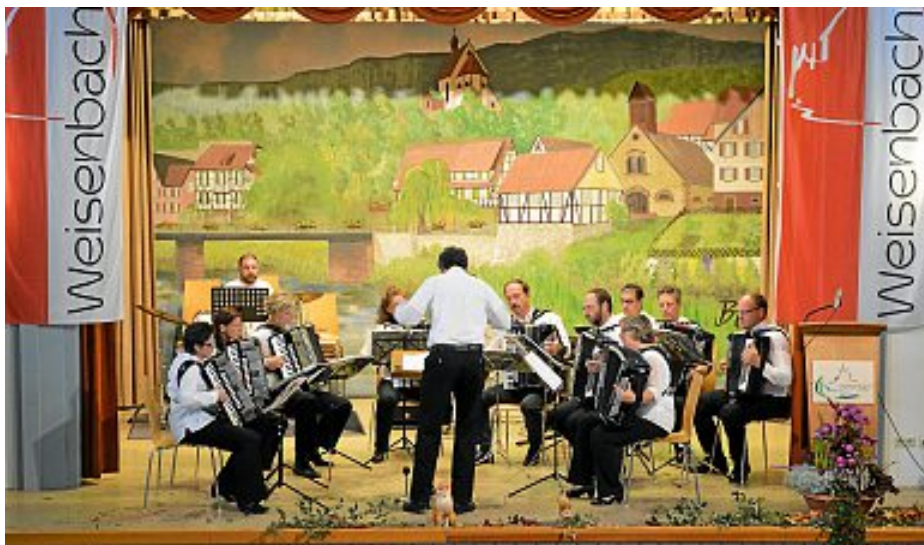
Gemeinsames Orchester Harmonika-Spielring

Bei frischem Novemberwetter waren rund 160 ältere Mitbürgerinnen und Mitbürger am vergangenen Sonntag der gemeinsamen Einladung der politischen Gemeinde sowie der katholischen und evangelischen Kirchengemeinden zum Weisenbacher Seniorennachmittag gefolgt.