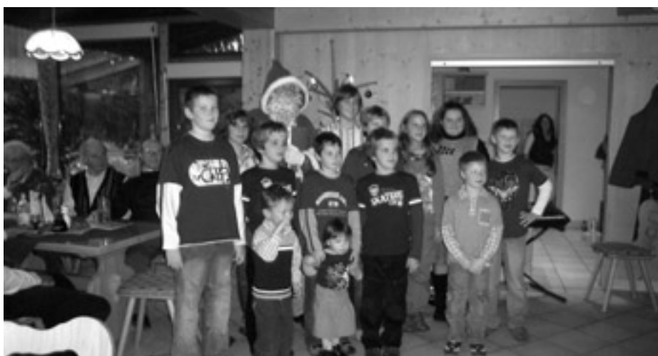
Der Nikolaus war im Naturfreundehaus.

Wir bitten unsere Gäste um Kenntnisnahme.