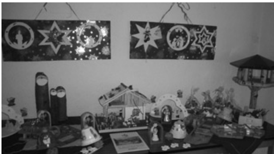
Das Resultat monatelanger Arbeit.

In den vergangenen Monaten wurde in den heimischen Werkstätten der NaturFreunde wieder fleißig gebastelt und gewerkelt. Die Besucher des Weisenbacher Weihnachtsmarktes können sich deshalb auf ein breites Angebot an handwerklichen Kunstwerken freuen.