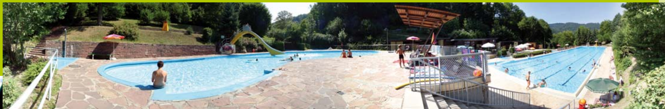
Rundumblick vom Nichtschwimmerbecken