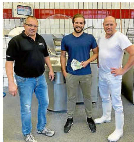
Spendenübergabe an die Grillhütte am Salmenplatz.

Bei einer direkten Fahrt in das von der Flut betroffene Ahrtal wurde nicht nur Mannskraft, sondern