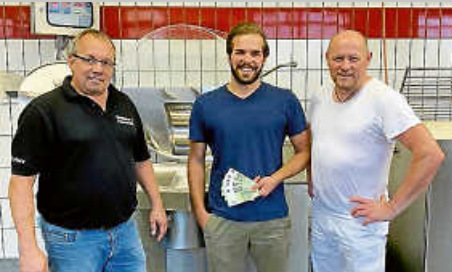
Spendenübergabe Wendelins Eventschmiede