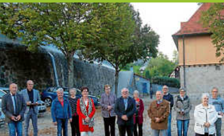
TV Weisenbach ehrt verdiente Mitglieder

Amtsblatt der Gemeinde Weisenbach Diese Ausgabe erscheint auch online