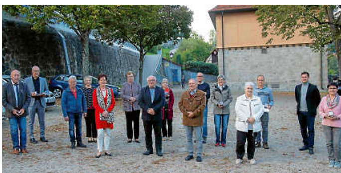
Die Geehrten des TV Weisenbach.