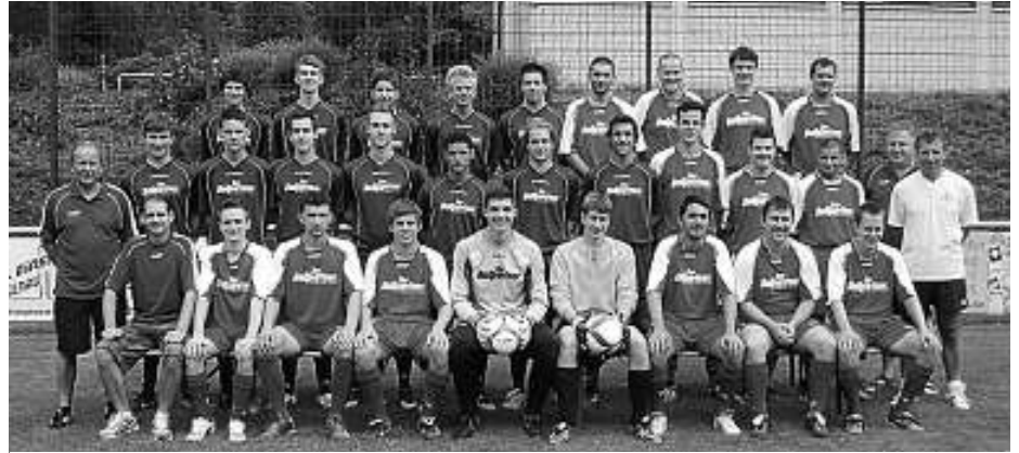
Das gesamte FCW-Team bedankt sich bei seinen treuen Fans und bittet auch in der kommenden Saison wieder um entsprechende Unterstützung.