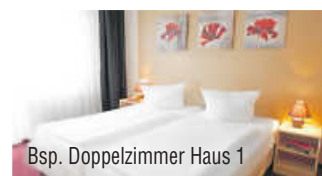
Bsp. Doppelzimmer Haus 1