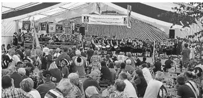
Übergabe der Gastgeschenke

Am kommenden Samstag beteiligen wir uns am Moonlight-Kegeln der Kolpingsfamilie. Wir wünschen unseren Mannschaften viel Erfolg.