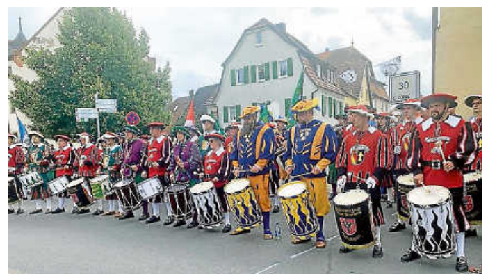
Sektion Süd beim Gemeinschaftsspiel