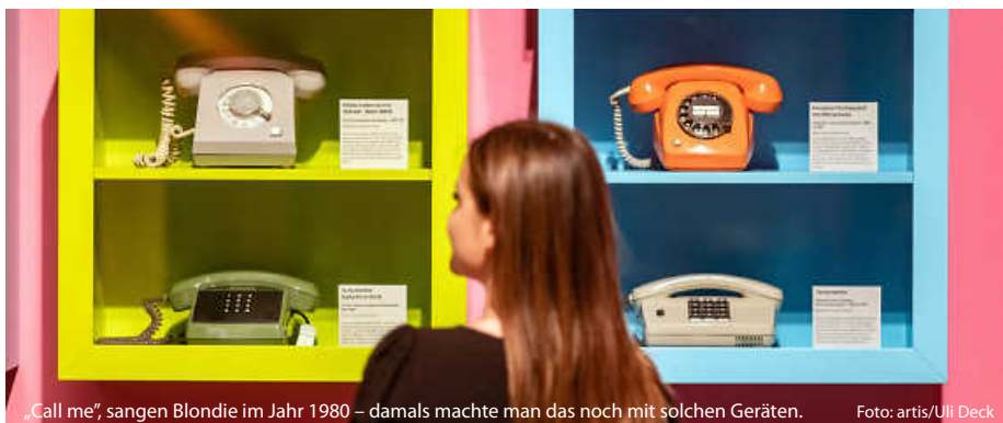
„Call me“, sangen Blondie im Jahr 1980 – damals machte man das noch mit solchen Geräten.

Heinz Rudolf Kunze stellte seine Gitarre bereit, Thomas Anders von Modern Talking den Bravo-Otto, Steffi Graf ihre Goldmedaille von Seoul. Und im November folgt ein weiteres Highlight: Udo Lindbergs legendäre Gitarre mit der Aufschrift „Gitarren statt Knarren“, die der Sänger 1983 Erich Honecker überreichte, findet dann ihren Weg nach Karlsruhe. Grund genug, sich einmal auf Zeitreise zu begeben, oder? (jr/tam)