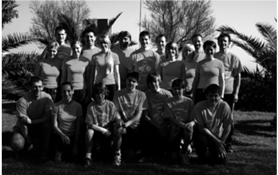
Die Leichtathleten in San Costanzo.

Aktuell: www.lag-obere-murg.de Termine 2007 (Klammer Meldetermini-