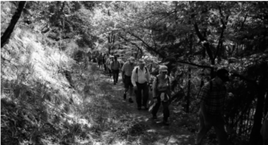
Große Beteiligung bei der Bezirksfrühjahrswanderung.

Die Teilnehmer der Wanderung zeigten sich überaus zufrieden über den Verlauf und dem Erlebten an diesem schönen Tag. Jeder konnte sich ausführlich mit Naturfreunden/innen der beteiligten Ortsgruppen von Rastatt, Michelbach, Hörden und Weisenbach unterhalten.