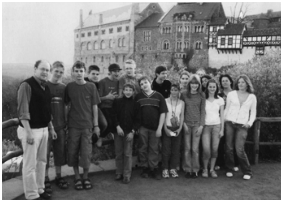
Konfirmandengruppe vor der Wartburg bei Eisenach.

Anschließend Besuch des Pergamonmuseums auf der Museumsinsel. Den