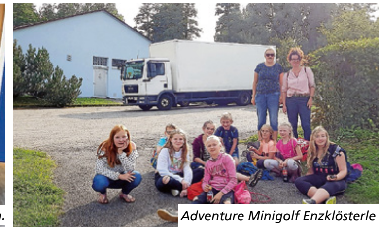
Adventure Minigolf Enzklösterle