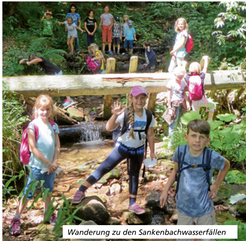
Wanderung zu den Sankenbachwasserfällen