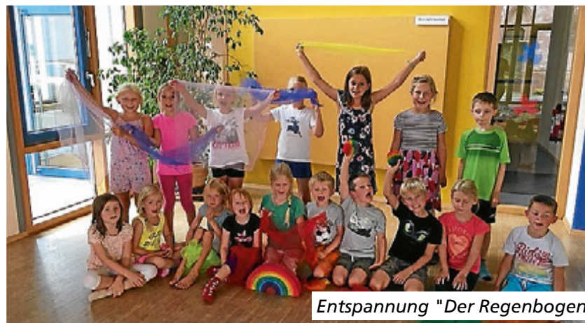
Entspannung "Der Regenbogen."