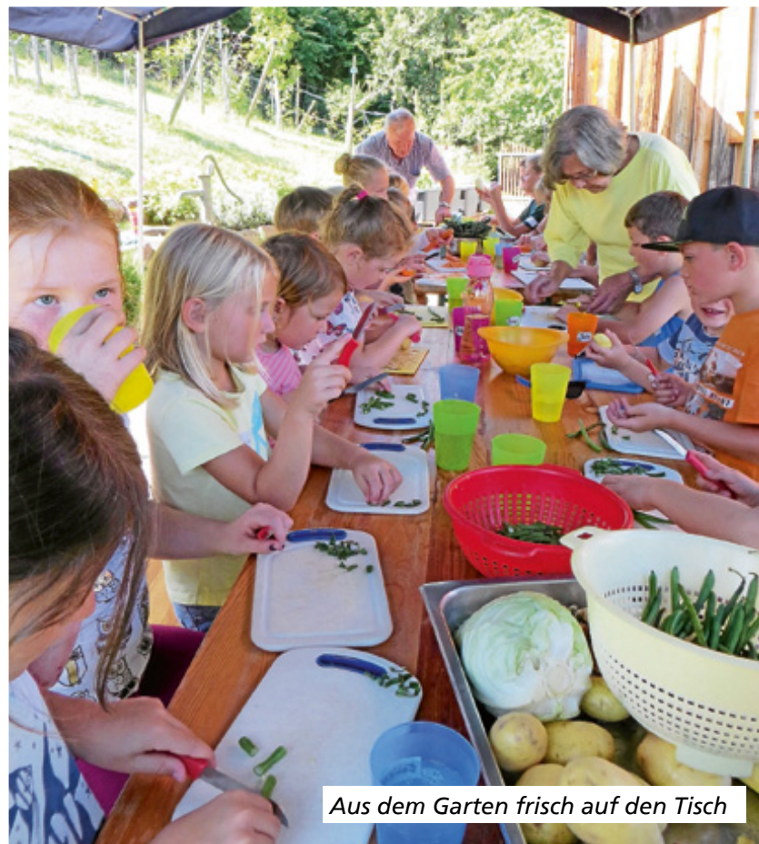
Aus dem Garten frisch auf den Tisch