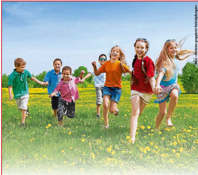
Foto: &lt;kleinere gruppierte Veranlagungen&gt;