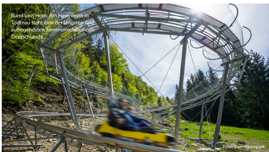
Rund ums Horn: Am Hasenhorn in Todtnau steht eine der längsten und aufregendsten Sommerrodelbahnen Deutschlands.

Und auch im Familienpark Westerheim kommen Rodelfans auf ihre Kosten. Hier auf der Alb findet sich nicht nur eine besonders rasante Strecke, nach der Fahrt reisen Gäste mit dem Lift rückwärts mitten durch das Dinoland. Nussbaum Abonnenten sparen dabei sogar. Also anschnallen und ab geht die wilde Fahrt! (jr/jr/red)