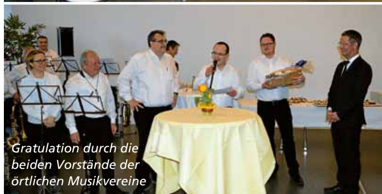
Gratulation durch die beiden Vorstände der örtlichen Musikvereine