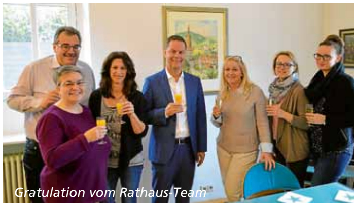
Gratulation vom Rathaus-Team