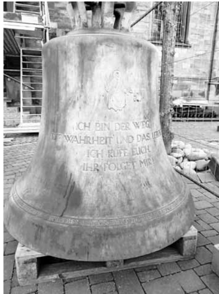
Die „Christusglocke“, die größte der Weisenbacher Glocken wird bald wieder ertönen.

Zügig gingen in den letzten Tagen die Arbeiten am neuen Glockenstuhl voran. Das Zimmergeschäft Weiler aus Forbach und die Fachfirma "Glocken- und Uhrentechnik" aus Schonach arbeiteten Hand in Hand, so dass nun die Inbetriebnahme der Glockenanlage bevorsteht. Weiterhin wurde die Elektroinstallation von der Firma Gerstner aus Hilpertsau erneuert. Nun steht in den nächsten Tagen die Inbetriebnahme bevor. Sollte dies ohne Probleme vonstattengehen kommen noch die Fachleute des KIT (Karlsruher Institut für Technologie) aus Karlsruhe zur Schwingungsmessung. Am Sonntag, 31. März, findet dann die feierliche Einweihung des neuen Glockenstuhles im Rahmen des Sonntagsgottesdienstes statt.