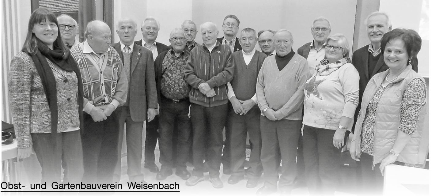
Obst- und Gartenbauverein Weisenbach