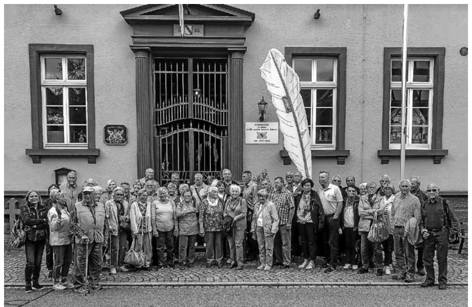
Ausflugsguppe vor dem Schulmuseum in Zell-Weierbach

Vor allem auf korrektes und diszipliniertes Verhalten legte er großen Wert. Der Rohrstock wurde allerdings nur angedroht. Im Museum war neben dem Klassenzimmer eine Lehrerwohnung um 1900, eine Nähstube, eine Sammlung tausender Schulbücher und ehemalige Lehr- und Lernmittel zu besichtigen. Nach dem Aufenthalt in einem Café in Achern erfolgte bei der ehemaligen Kreispflegeanstalt „Hub“ in Ottersweier eine Führung durch einen Vertreter des dortigen Bürgervereins. Das frühere Heilbad, Kurhaus und Pflegeheim hat sich ab 2004 unter der Trägerschaft der Klinikum Mittelbaden gGmbH zu einem mo-