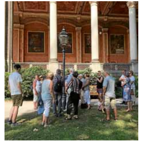
Stadtführung an der Trinkhalle Baden-Baden