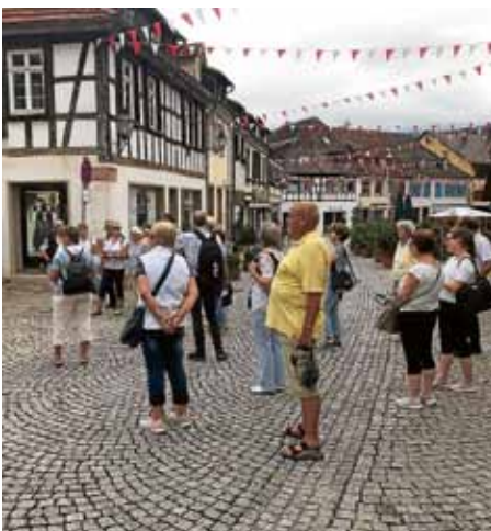
Altstadt von Gernsbach

Die Reisegruppe trat fröhlich und ausgelassen um 14.00 Uhr die Heimfahrt nach Kriebstein an und dankte dem Organisationsteam für diesen schönen Aufenthalt. Zum diesjährigen Weihnachtsmarkt in Weisenbach im Dezember wird die Partnergemeinde Kriebstein wieder vertreten sein und alle Teilnehmer freuen sich bereits heute auf das nächstjährige 30-jährige Bestehen der Partnerschaft, das von 1. bis 4. Oktober 2020 in Kriebstein gefeiert werden soll.