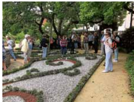
Katzscher Garten in Gernsbach