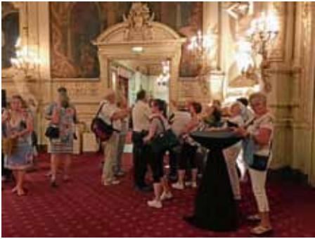
Führung im Casino Baden-Baden