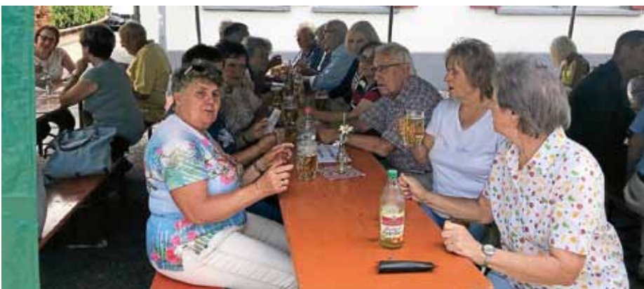
Festausklang am Sonntag