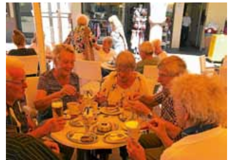
Eiscafe in Freudenstadt