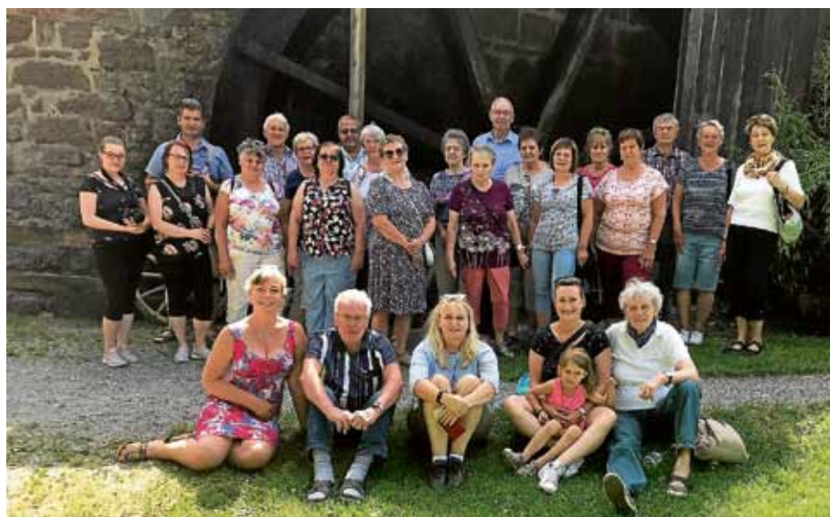
Vor der schönen Mühle

Am Samstag traf man sich mit einer Stadtführerin zu einem Besuch in Baden-Baden. Die Stadtführerin erklärte den Besuchern eindrucksvoll Baden-Baden und seine Geschichte vom Mittelalter bis zur Renaissance und Neuzeit. Auch eine Führung im schönen Casino Baden-Baden war in der Führung beinhaltet und brachte die Besucher zum Staunen. Nach einem zünftigen Mittagessen im Löwenbräu Baden-Baden ging man am Nachmittag noch mit den Besuchern, die nicht unbedingt nur shoppen wollten, auf den Hausberg von Baden-Baden, dem Merkur. Dort konnte man unter anderem die Aussicht und etliche Gleitschirmflieger betrachten. Am Samstagabend besuchte die Reisegruppe das Jubiläumsfest zum 95-jährigen Bestehen des Musikvereines Weisenbach und ließ dort den Abend ausklingen.