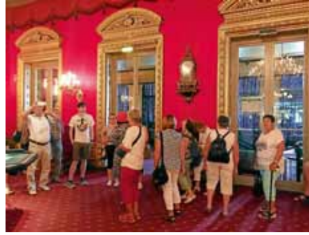
Stadtführung im Casino Baden-Baden