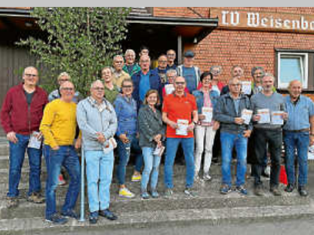
Sportabzeichenvergabe beim TV Weisenbach