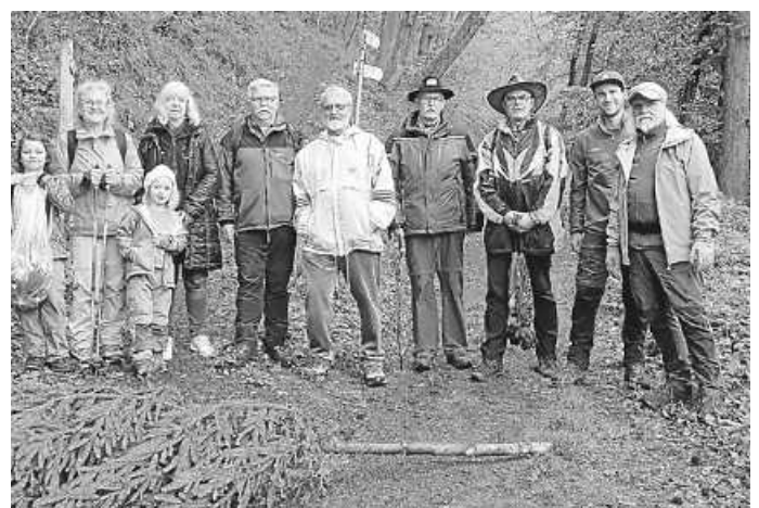
Der Start in der Weng