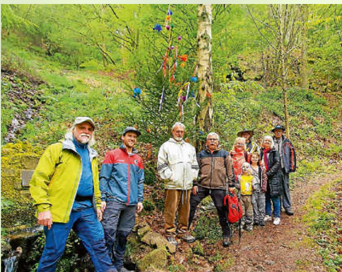
Saubrunnen - Naturfreunde