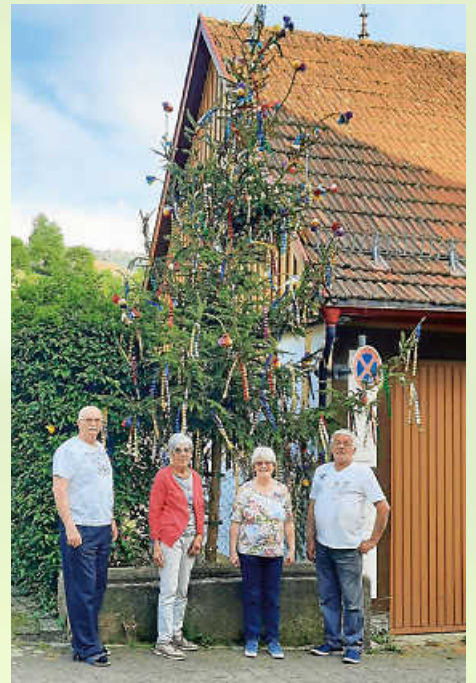
Kelterstraße - Spritzenhaus