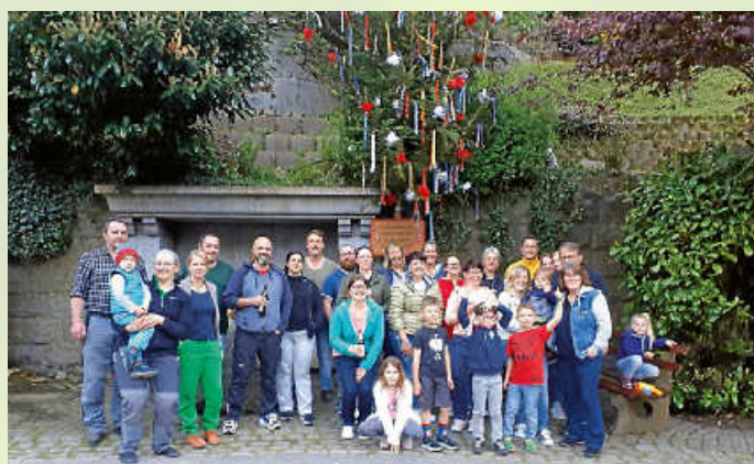
Beim alten Feuerwehrgerätehaus Au