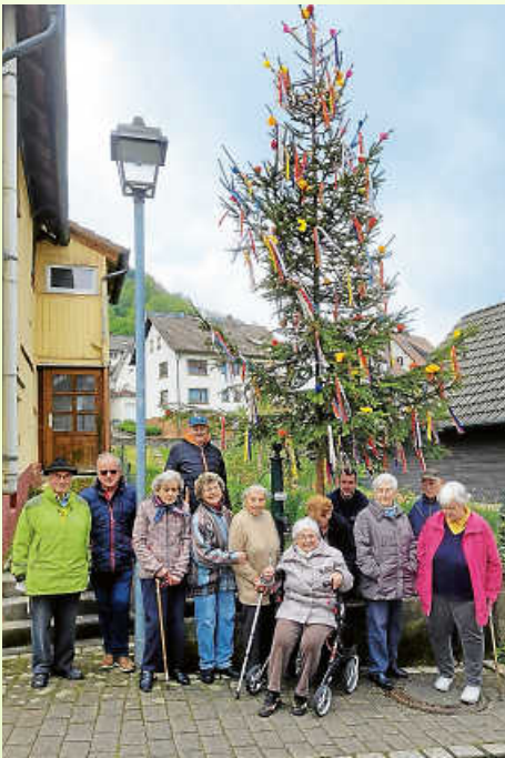
Mittlere Gaisbach - Einmündung Strietweg