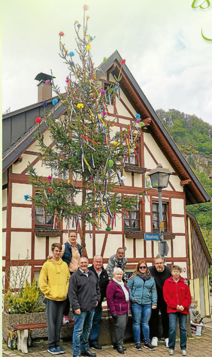
Gaisbachstraße - Einmündung Wandweg