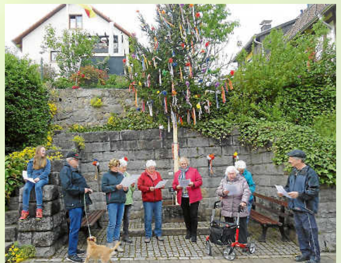
Obere Gaisbach - Einmündung Steinedeck