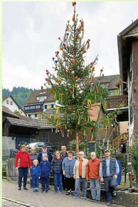
Untere Gaisbach - Einmündung Torweg