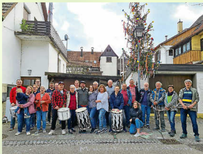
In den Höfen