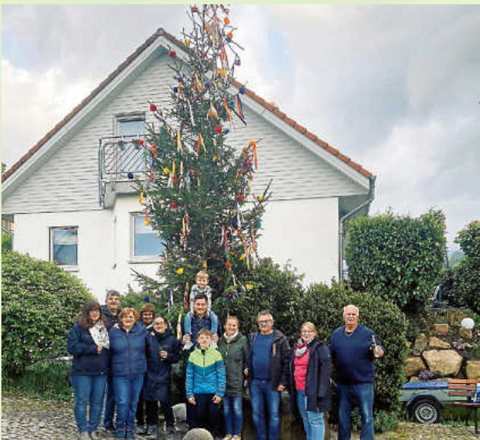
Kriebsteinbrunnen - Birket