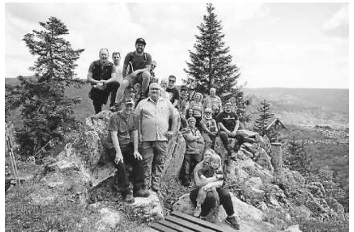
Am kleinen Matterhorn.

Nun sind wir gut motiviert, um in den kommenden Wochen unser 65. Jubiläum vorzubereiten. Gefeierte wird vom 09. - 10. Juli mit einem Festzelt auf dem Schulhof.