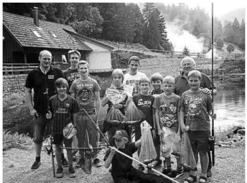
Stolz präsentieren die Kinder und Jugendlichen ihren Fang

te, brach man den Heimweg an. Eine tolle Erinnerung blieb allen an das erste große Angelerlebnis.