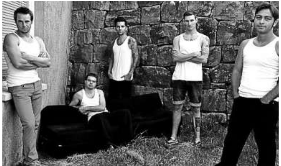
Die „Söhne Weisenbachs“

Ab 18:00 Uhr wollen wir mit Livemusik für gute Stimmung sorgen. Wie bereits im letzten Jahr startet um 18:00 Uhr zunächst die Band "Charly's Silence". Die Band "Charly's Silence", vormals "AmpteaV" sind sechs junge Musiker aus dem Raum zwischen Rastatt und Gaggenau, die es sich zur Aufgabe gemacht haben jeden Song zu rocken. Daraus entstand eine Setliste, die Lieder aus den Fünfzigern bis heute beinhaltet. Es gibt kaum einen Stil, der nicht gespielt wird, jeder Einzelne im Publikum kommt auf seine Kosten. Jedem Song drückt die Band ihren eigenen Stempel auf, getreu dem Motto: „Das ist kein Song für eine Party, also machen wir einen draus.“ Mit jedem Ton gibt die Band ein Stück von der Freundschaft weiter, die sie auch privat verbindet und ermuntert das Publikum mit ihnen diesen wunderschönen Abend, welcher immer das