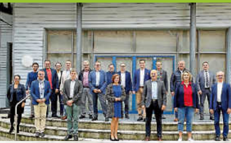
Kreisversammlung des Gemeindetags in Weisenbach

Amtsblatt der Gemeinde Weisenbach Diese Ausgabe erscheint auch online