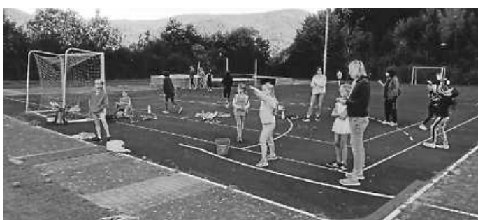
Leichtathletiknachwuchs beim Ballwurf.

Für die Jüngsten des Leichtathletiknachwuchses fanden in diesem Jahr gar keine Wettkämpfe statt. Deshalb richtete die LAG am 23.9. für die eigenen Schüler/innen Drei- und Vierkämpfe in Weisenbach aus. Maya Möhrle (W15) siegte mit 1.427 Pkt. im Vierkampf. Ihre besten Leistungen hatte sie im 100-m-Lauf in 14,4 s. und beim Weitsprung mit 4,26 m. Julia Dieterle kam auf 1.118 Pkt.. In der Klasse M13 erreichte Max Wolff 1.398 Pkt. Er lief die 75 m in 10,8 s.; sprang 4,20 m weit und 1,24 m hoch. In der Klasse W11 siegte Mia Mattia beim Drei- und Vierkampf