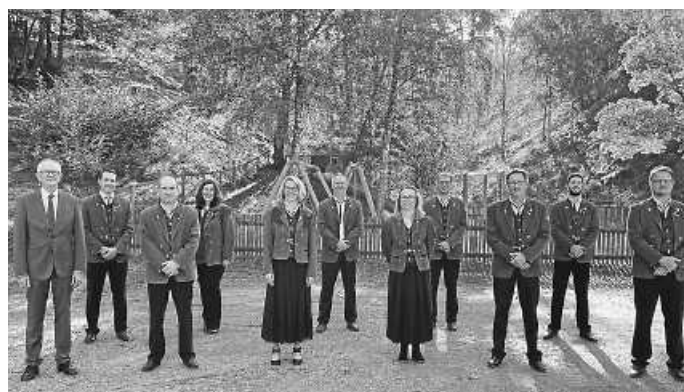
Die geehrten Musikerinnen und Musiker.

Da die Konzerte der Musikkapelle im Jahr 2020 und 2021 leider coronabedingt nicht stattfinden konnten, wurde dieser feierliche Rahmen auch dazu genutzt, um verdiente Musikerinnen und Musiker für ihre langjährige Aktivität zu ehren.