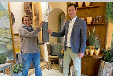
20 Jahre Blumen Elke