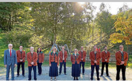
Ehrungen bei der Musikkapelle Au