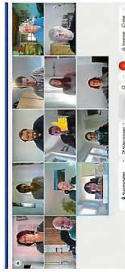
Mönschens Familienforschung BW, Online-Generationsmehrblog

IMPRESSUM: Familienforschung Baden-Württemberg im Statistischen Landesamt, Böblinger Straße 68, 70189 Stuttgart