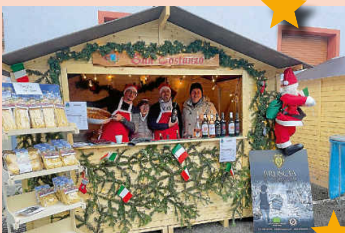
Partnergemeinde San Costanzo.