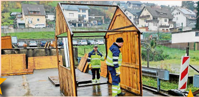
Aufbau der Hütten durch den Bauhof.