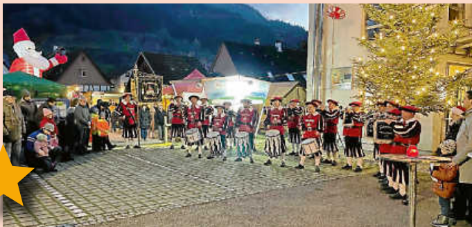
Auftakt durch den Fanfarenzug Weisenbach.