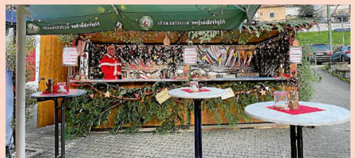
KG „Hohle Eiche“.