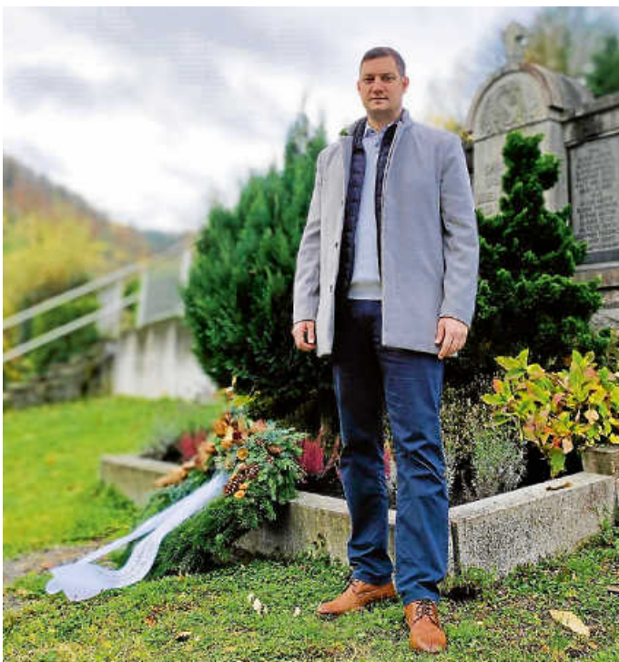
Kranzniederlegung Friedhof Au