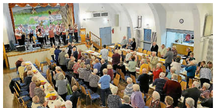
Der Musikverein Weisenbach spielt beim Seniorennachmittag.