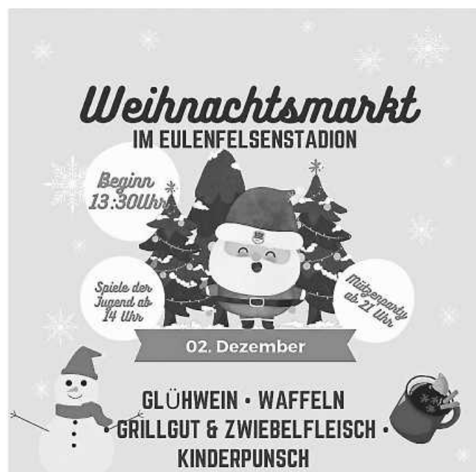
Weihnachtsmarkt im Eulenfelsenstadion