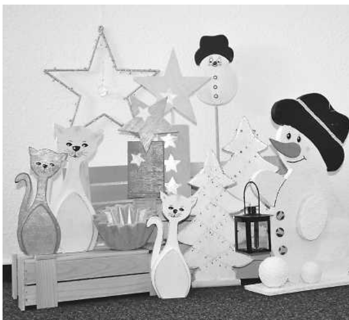
Bazars der Lebenshilfe Rastatt/Murgtal e. V.

Nebenbei können Sie sich über die aktuellen Projekte und Herausforderungen der Lebenshilfe, wie z. B. der Um- und Erweiterungsbau des Richard-Kunze-Haus in Rastatt-Niederbühl oder die Gestaltung des Parkhotels in Gaggenau zu einem „Haus der Inklusion“, aus erster Hand informieren.