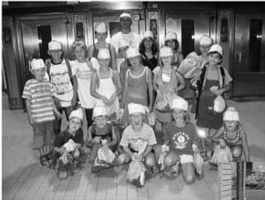
Ein lohnender Besuch bei der Bäckerei Weiler in Hilpertsau

Der Erlebnistag in der Bäckerei war wirklich ein super Erlebnis, das das Team der Bäckerei den Teilnehmern ermöglicht hat.