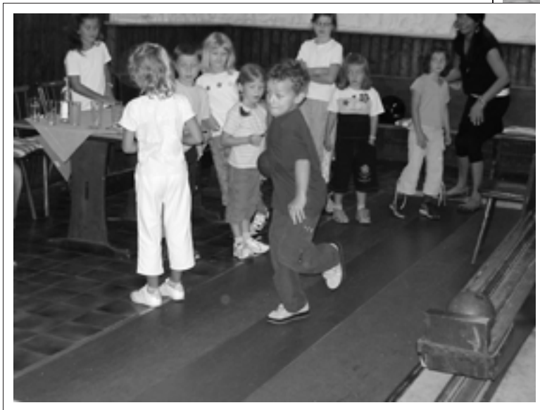
Kegelturnier - durchgeführt vom Freizeitclub Weisenbach