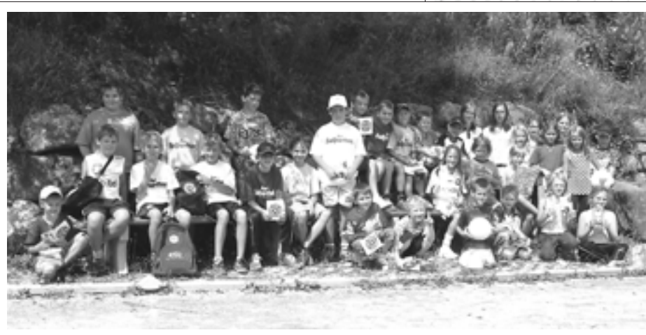
Spielenachmittag bei der Fußballabteilung