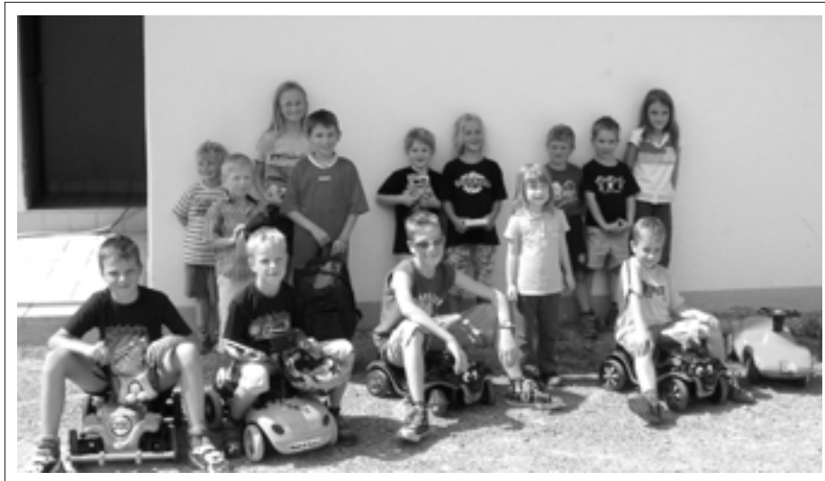
Bobby-Car-Rennen durchgeführt durch den jungen Chor des Gesangsvereins Au