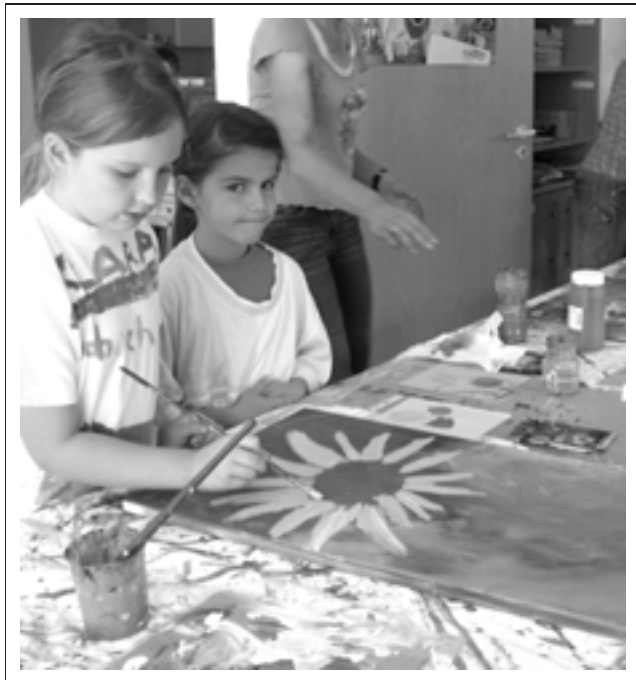
Kleine Künstler - gefördert durch die Frauengemeinschaft Weisenbach