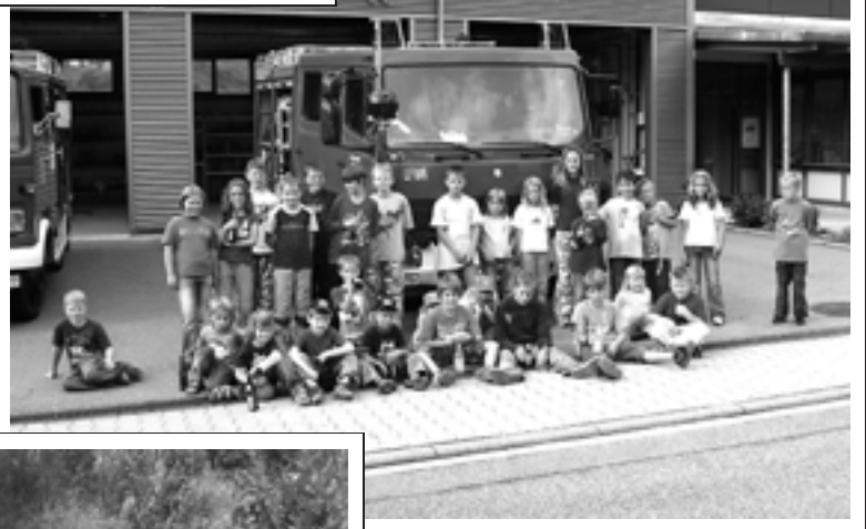
Ein Tag bei der Feuerwehr