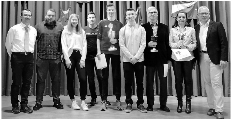
Kaderathleten der LAG mit den Pokalgewinnern.