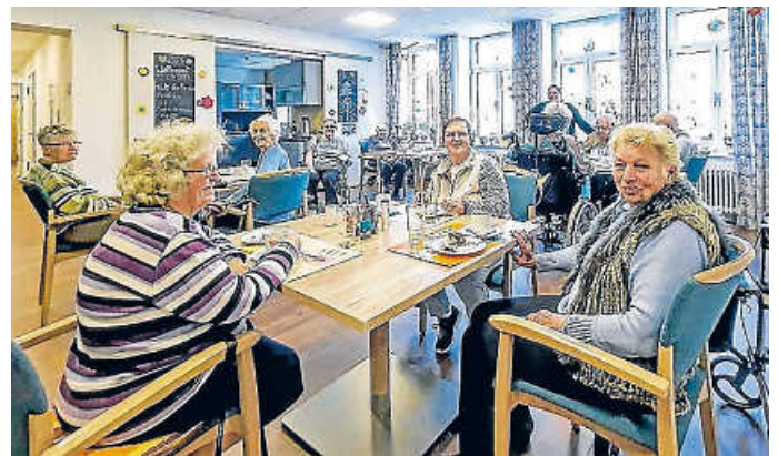
Wie immer am wichtigsten: Geselligkeit und gute Stimmung.

TAG DER OFFENEN TÜR am 01.07.23, 13.00 bis 17.00 Uhr.