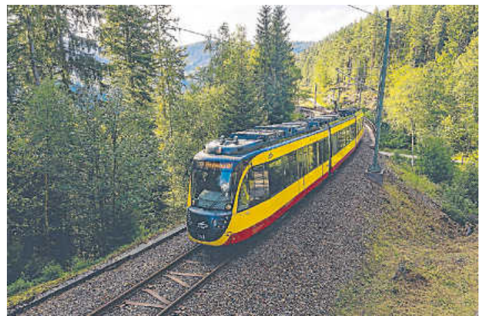
Aufgrund von nächtlichen Tunnelprüfungen auf der Murgtalbahn kommt es zwischen dem 15. und 17. Mai zu Einschränkungen bei der AVG-Stadtbahnlinie S8.

In diesem Zeitraum finden die Tunnelprüfungen zwischen Forbach und Baiersbronn statt. Aus diesem Grund müssen die nächtlichen Züge der Linie S8 zwischen Forbach und Baiersbronn entfallen. Für die Fahrgäste wird mit Bussen ein SEV eingerichtet.