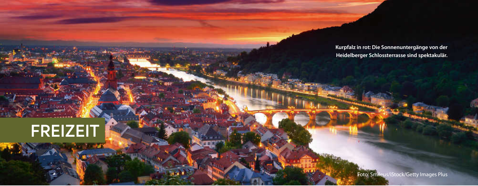
Kurpfalz in rot: Die Sonnenuntergänge von der Heidelberger Schlossterrasse sind spektakulär.