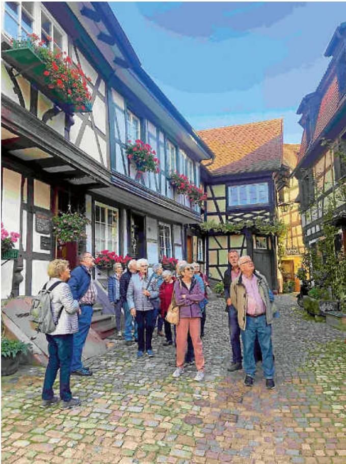
Altstadtführung in Gengenbach.

Im Anschluss an die Kellerführung haben alle Teilnehmerinnen und Teilnehmer den frühen Abend mit einer Weinprobe und Winzervesper fröhlich ausklingen lassen, bevor dann wieder die Heimreise nach Weisenbach angetreten wurde.