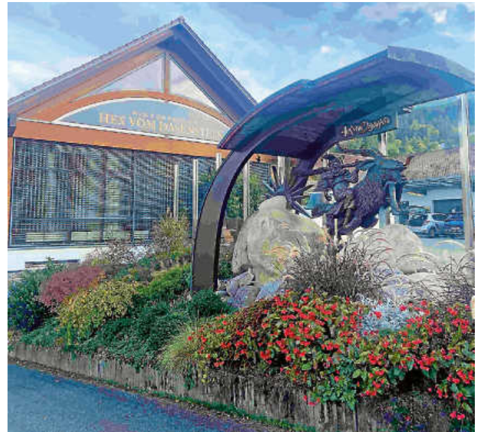
Winzerkeller Hex vom Dasenstein.