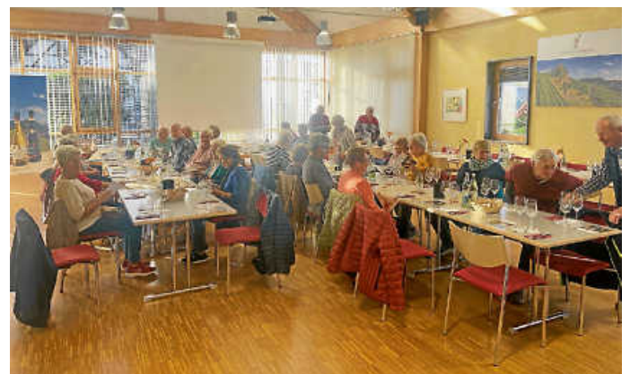
Vesper im Winzerkeller.