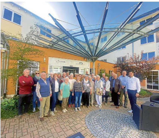
Mittagessen im Schwarzwaldhotel.