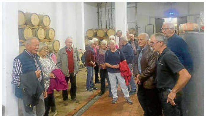
Kellerführung im Winzerkeller.