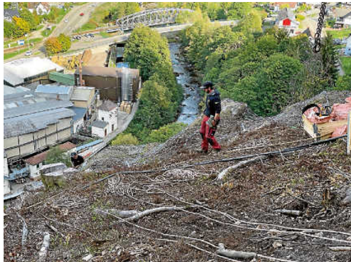
Firma HTB beim Netzspannen.

Die Arbeiten laufen bei der derzeit guten Witterung planmäßig. So hofft die Gemeinde, dass die Arbeiten bis Ende Oktober abgeschlossen und die Straße dann wieder für die Schülerinnen und Schüler sowie den Rad- und PKW-Verkehr freigegeben werden kann.