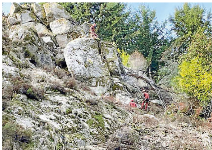
Firma HTB beim Einspritzen der Mörtelmasse.

Die Arbeiten der Firma HTB sind nicht ungefährlich, denn sie müssen sich aus großer Höhe abseilen und immer wieder absichern, um auf dem steinig und teilweise losen Untergrund nicht abzurutschen.