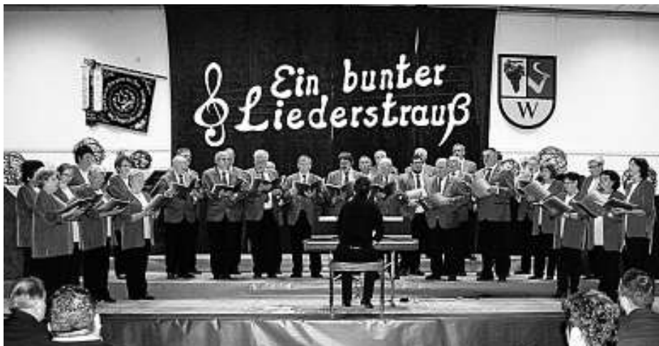
Der Gesangverein „Eintracht“ Au

Seit vielen Jahren pflegt die „Eintracht“ eine Freundschaft zum Männerchor Waldulm, woraus auch die Idee entstand ein gemeinsames Konzert zu veranstalten. Dazu kam der Männerchor Baiersbronn-Obertal, der auch schon seit Jahren Verbindungen zu den Waldulmer Sängern pflegt.