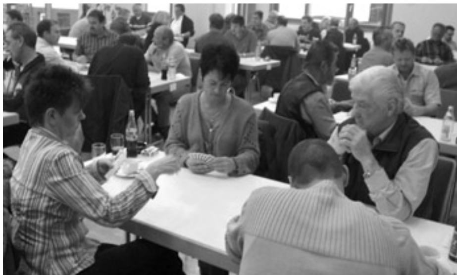
Viele Teilnehmer trafen sich im Gemeindezentrum zum Skat.

Ein bereits traditionelles Ereignis war das 18. Mannschafts-Skatturnier des Freizeitclub Weisenbach am 1. November im Gemeindezentrum. In diesem Jahr nahmen 22 Mannschaften und mehrere Einzelspieler teil. Die seit Jahren hohe Teilnehmerzahl zeigt, dass das Turnier inzwischen einen festen Platz im Kalender der Spielerinnen und Spieler gefunden hat. Hoch konzentriert reizten sie fast fünf Stunden um den Skat und kämpften um die Punkte. Und manches Spiel wurde noch Stunden danach intensiv diskutiert.