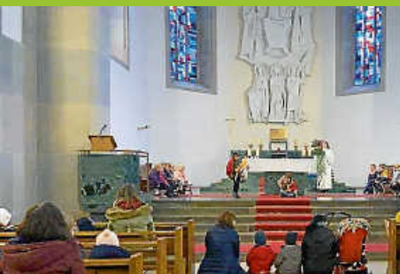
St. Martin vom Kindergarten

Amtsblatt der Gemeinde Weisenbach Diese Ausgabe erscheint auch online