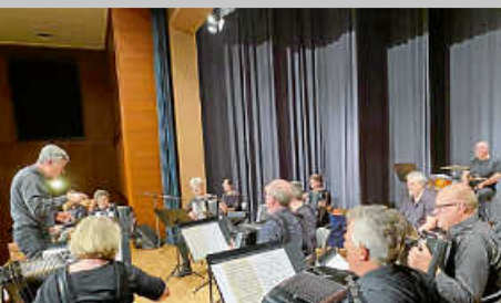
Erfolgreiches Konzert des Harmonika-Spielrings